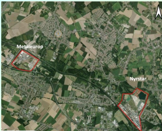
Figure 1 : Localisation de Metaleurop et Nyrstar